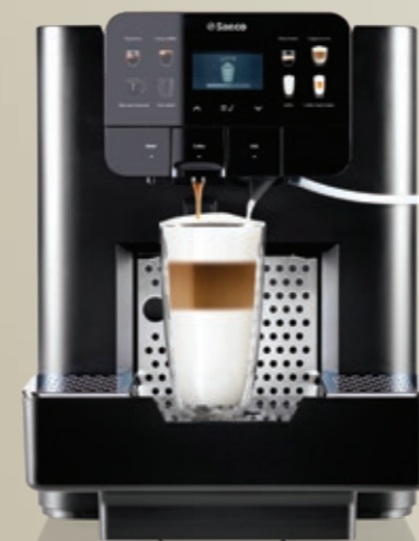
AREA OTC HSC Nespresso®*

Attacco rete idrica opzionale (con kit rete idrica)