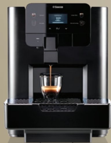
AREA Focus Lavazza Blue®*

Attacco rete idrica opzionale (con kit rete idrica)