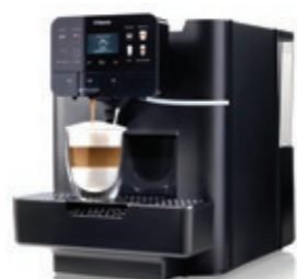
Area OTC HSC