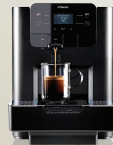
AREA Focus Nespresso®*

Attacco rete idrica opzionale (con kit rete idrica)