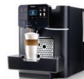
Area OTC HSC