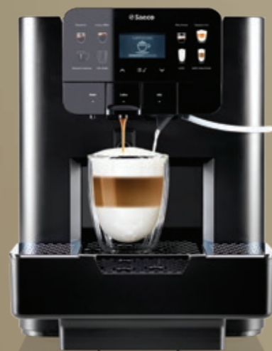
AREA OTC HSC Lavazza Blue®*