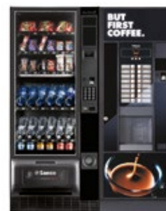
Artico S + Oasi 400