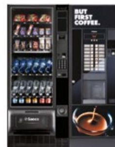
Artico L + Oasi 600